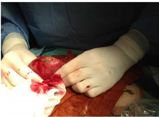
Figura 1 Extracción de íleo biliar mediante incisión de asistencia.

para indicar un abordaje laparoscópico en la oclusión intestinal fueron los siguientes.